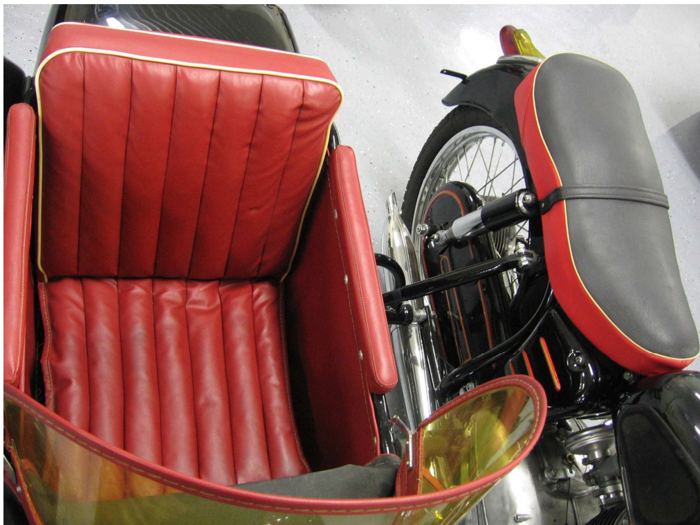
Vaade sõiduki istme(te)le