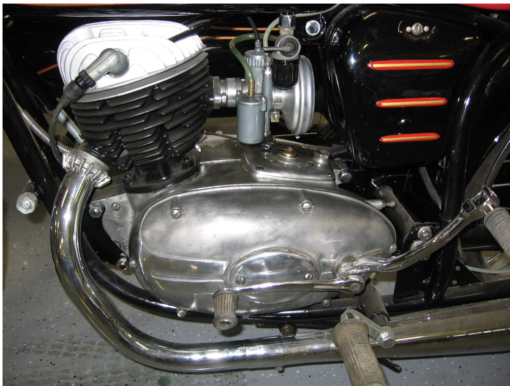
Vaade mootorile ühelt küljelt