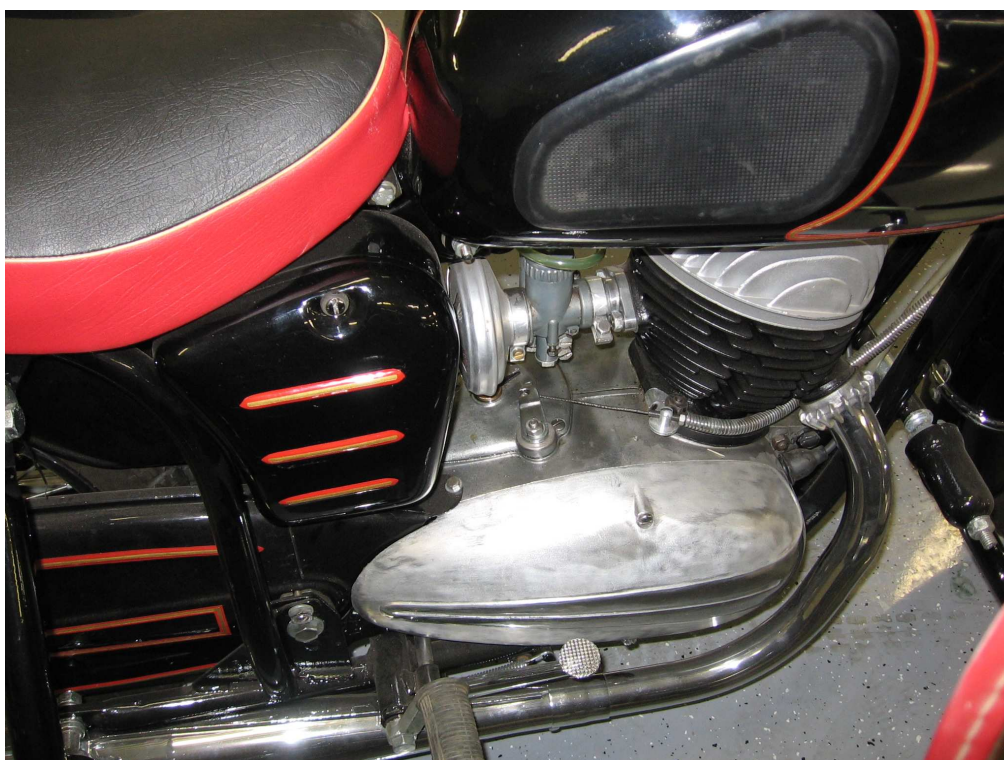
Vaade mootorile teiselt küljelt